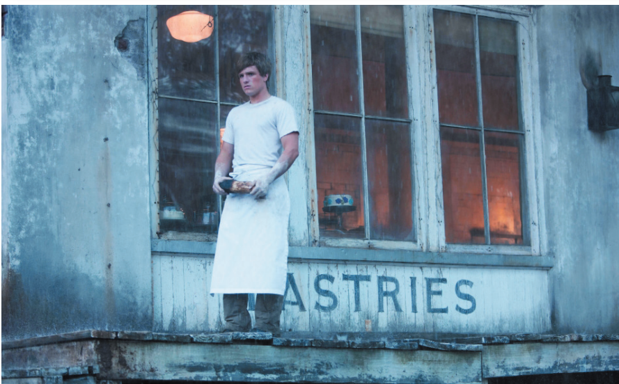
Часть сцен снимали в заброшенной деревушке с покосившимися домиками

нитые ILM и Rhythm & Hues, а также The Third Floor. Часть кадров подготовили художники Pixomondo – компании, которая была основным вендором проекта «Хранитель времени 3D» Мартина Скорсезе, удостоенного премии «Оскар» за визуальные эффекты.