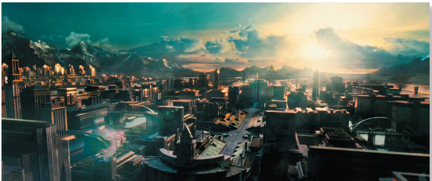
Полностью компьютерные панорамные планы столицы государства Панема

Ярким тому подтверждением служит эпизод с огненной стеной и шарами, которые не дают героине выйти за границы игровой зоны. Огонь был симулирован преимущественно на компьютере трехмерщиками студии Hybride, которые использовали для этого систему частиц. В ряде планов огонь был настоящим, то есть пиротехническим эффектом, но из соображений безопасности таких кадров было немного. Да и интенсивность реального пламени была слабой, так что цифровая симуляция пришлась весьма кстати, она