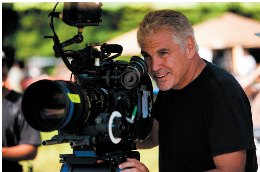
Режиссер фильма Гэри Росс захотел снимать фильм на пленку

Но наиболее зрелищные планы относятся к демонстрации видов Капитолии и сцен в лесу, когда начинается игра на выживание. В картине «Голодные игры» 1200 планов с визуальными эффектами, которые создавались в кратчайшие сроки. На все про все у специалистов по компьютерной графике было 23 недели. При этом львиная доля эффектов носит невидимый характер, поскольку режиссер картины хотел снять фильм в более или менее реалистичном стиле, сфокусировавшись на действиях героини. В работу над фильмом вовлекли дюжину студий, в том числе име-